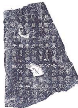
Estampado de la Inscripción de los Clásicos, China, principios del siglo 20.

Las colecciones les llevan al encuentro de civilizaciones antiguas y de mitos relacionadas con la aparición de escrituras les permiten seguir con el dedo el trazo de caracteres cuneiformes, egipcios, chinos e incluso el de los misterios glifos mayas.