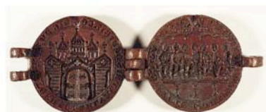
Matriz del sello de la ciudad de Figeac, siglo 13.