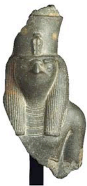
Horus con cabeza de falcón, Egipto, siglos 7-6 antes de Jesucristo.

Sus cartas nos permiten también acompañar al investigador en su expedición al Nilo y descubrir con él, el antiguo Egipto , los dioses de múltiples caras, las momias y el mobiliario que les acompañaba al más allá.