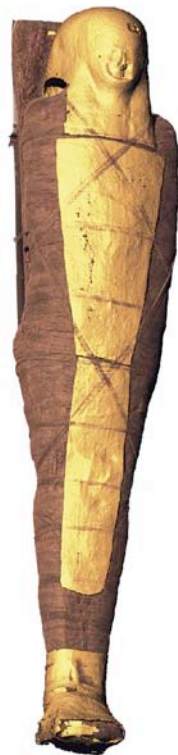
Reconstrucción de la momia

Se puede ver también un documento inédito: la reconstrucción en tres dimensiones de una momia.