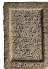
Dedicatoria de Nebuza al dios Abgal, Palmira, año 263 antes de Jesucristo.