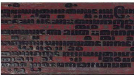
Manuscrito escrito en estípites de palmera, Myanmar, no fechado.

El lugar invita a los visitantes a interrogarse sobre el acto de escribir y su significación.