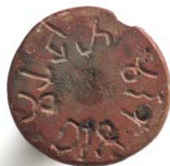
Sello inscrito en brahmi, India, siglos 3-1 antes de Jesucristo.