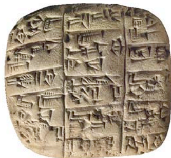
Tabla inscrita en cuneiforme, Irak, finales del tercer milenario antes de Jesucristo.

Desde México a China pasando por Egipto y Mesopotamia, descubra como las primeras escrituras nacieron entre el IVo y el Ier milenario a. J.C.