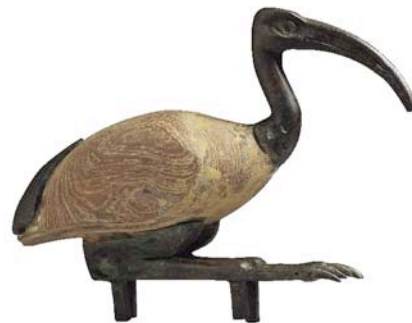
Thot, el dios de la escritura, con la forma de ibis, Egipto, siglos 7-6 antes de Jesucristo.