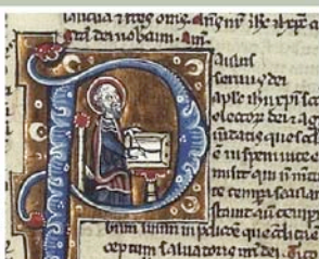
San Pablo escribiendo, detalle de una biblia ilustrada, París, 1230.

El libro apareció al principio de nuestra era: le contaremos aquí su historia prestigiosa, desde su invención hasta la primera era del numérico. Esta historia está marcada por la llegada del papel en Europa y por el auge rápido de la impresión . También está ilustrada por la presencia y el gesto de los actores de lo escrito, desde el escriba medieval hasta el informático del siglo XXI.