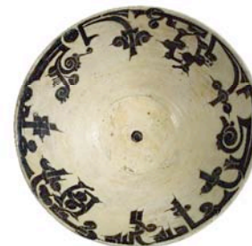
Copa inscrita en árabe kufico, Irán, siglos 9-10.