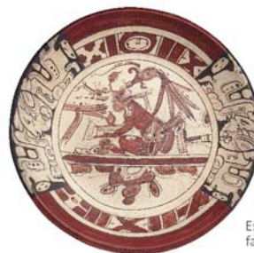
Escriba maya, México, facsimil.