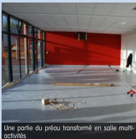
Une partie du préau transformé en salle multi-activités