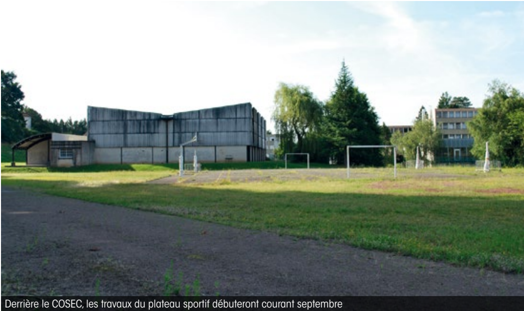
Derrière le COSEC, les travaux du plateau sportif débiteront courant septembre