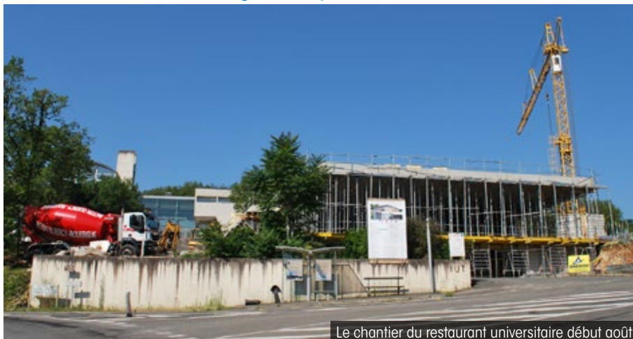
Le chantier du restaurant universitaire début août

Depuis son ouverture en 1995, l'Institut Universitaire de Technologie de Figeac n'a cessé de se développer. Près de 450 étudiants étaient inscrits l'an dernier. Construit sur les hauteurs de Nayrac, l'établissement a déjà fait l'objet d'une première extension en 2007 afin d'accueillir son 3 ème département. Pour répondre à la demande croissante de formation et à l'augmentation des effectifs, une seconde extension des locaux a été décidée. Le chantier est ouvert depuis le mois de février pour 16 mois de travaux.