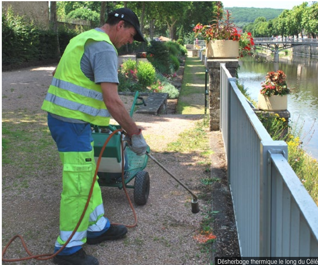
Désherbage thermique le long du Célé