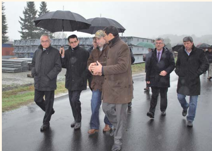
Visite de la zone d'activités par les officiels. En fond, les installations de l'entreprise Matière.

En six mois, 3,6 ha, dont 3 ha commercialisables, ont