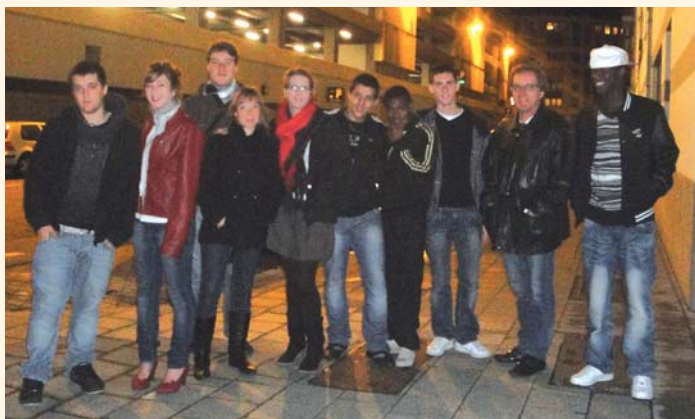
Les jeunes cajarcois à Bruxelles, encadrés par leurs deux animateurs.

Dans le cadre d'un "projet européen d'échanges jeunes", huit jeunes de Cajarc ont passé une semaine à Bruxelles pendant les vacances de Toussaint. Un voyage organisé par l'Espace Jeunes intercommunal de Cajarc suite à un premier échange proposé cet été, dans le cadre du festival Africajarc.