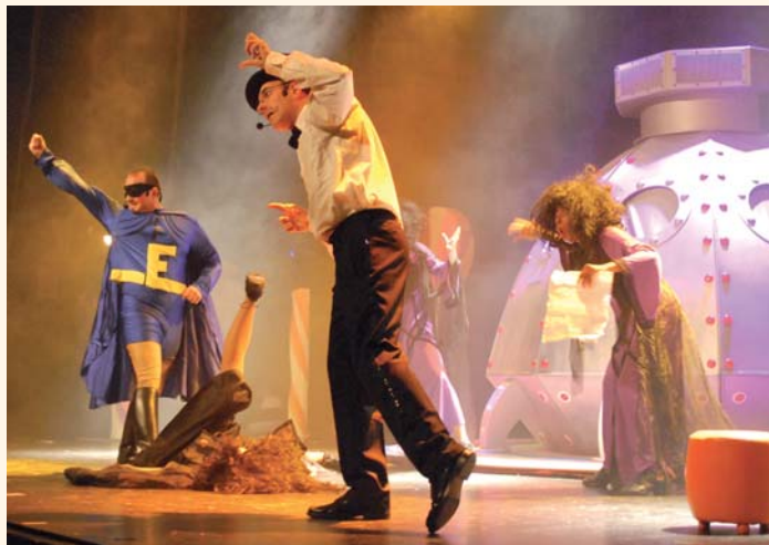
Décor, costumes, lumières, chansons... tous les ingrédients étaient réunis !

Bravo à la commission Animation de l'O.I.S. et au service Petite Enfance du C.I.A.S. qui, pendant plusieurs mois, se sont mobilisés pour organiser cet événement !