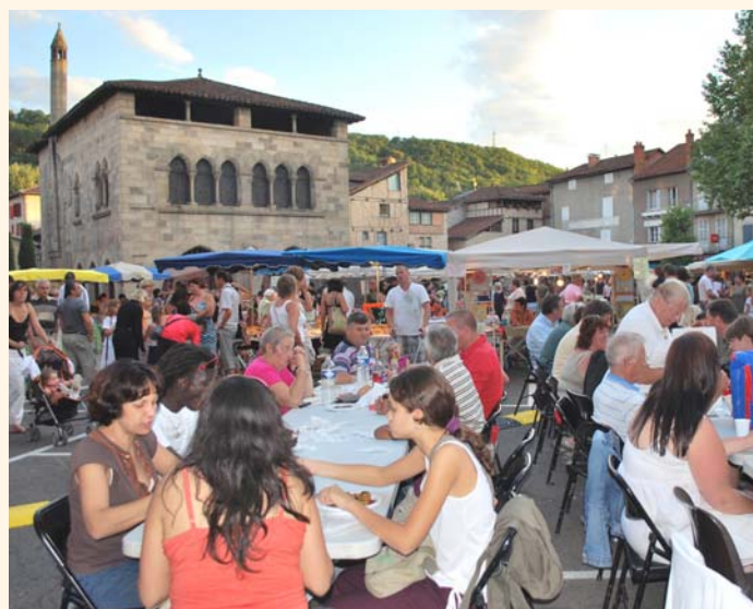
Les marchés nocturnes, une animation toujours très appréciée.

(*) Bagnac-sur-Célé, Capdenac-Gare, Capdenac-le-Haut, Faycelles, Figeac et Marcilhac-sur-Célé.