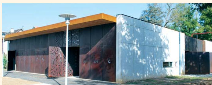
Un bâtiment de conception résolument moderne.

Une opération de 925 697 € H.T. (805 697 € pour le bâtiment et 120 000 € pour l'équipement informatique et le mobilier) pour laquelle Figeac-Communauté a reçu le soutien financier de l'Europe, de l'Etat, de la Région Midi-Pyrénées et du Département de l'Aveyron. Et Martin Malvy de souligner : "La Communauté trouve ici sa raison d'être (...) Ce projet prouve, s'il en était encore besoin, que les frontières ne sont qu'administratives".