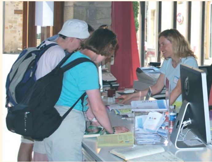
L'Office de Tourisme : un passage obligé pour organiser au mieux son séjour.

Satisfaction aussi du côté des animations. Les visites guidées ont rassemblé 1 468 personnes à Figeac et 417 dans les villages de la Communauté. 3 375 personnes ont découvert Figeac grâce au Petit Train (+ 8 %). Les marchés nocturnes et les brocantes ont encore remporté un franc succès auprès des