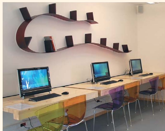
Un bel espace dédié au multimédia

De plain-pied, donc entièrement accessibles aux personnes handicapées, les 420 m 2 du nouveau bâtiment répondent à toutes les exigences d'une bibliothèque multimédia : ordinateurs en libre accès avec connexion internet, espace multimédia (DVD et CD audio), presse et périodiques, romans, documentaire, bandes dessinées et un espace consacré aux albums jeunesse.