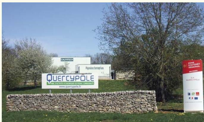
L'entrée du parc d'activités et en arrière plan la pépinière d'entreprises.

Autre projet d'installation, celui de la société AT2D, spécialisée dans les tests pour l'industrie aéronautique et actuellement domiciliée à la pépinière. Dans ses nouveaux locaux, l'entreprise a le projet d'accueillir et d'employer une partie de l'année les salariés de la structure Lot Insertion Services (espaces verts).