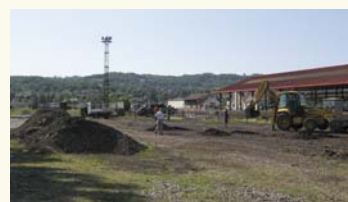
L'extension de la zone : 2 ha situés en bordure de la voie ferrée.