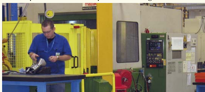
Les ateliers de Ratier Figeac.

hélices et demande si des terrains sont disponibles à proximité de son site de fabrication, route de Cahors. Une demande à laquelle nous nous devons de répondre favorablement pour permettre à Ratier de se développer sur place et éviter le risque de voir une partie de son activité migrer vers la région toulousaine ou ailleurs. Malgré des délais très courts, la municipalité, consciente de l'enjeu, a tout mis en œuvre. Rapidement, les négociations avec les propriétaires se sont engagées et, en quelques mois, la Ville de Figeac a fait l'acquisition de 12 ha. Un an après, la zone était aménagée et l'entreprise construisait ses nouveaux bâtiments. Par la suite, Ratier-Figeac de par un accord avec la société Hamilton - qui appartient désormais au même groupe américain United Technology que l'entreprise figeacoise - réussira à « récupérer » la fabrication des moyeux fabriqués par Hamilton aux Etats Unis. C'est donc plus de 80 % des hélices du monde qui sont fabriquées aujourd'hui sur Lafarrayrie. Depuis 2003, cette zone affiche « complet ». Elle compte aujourd'hui 1 300 emplois, dont un peu plus de 900 pour la seule entreprise Ratier-Figeac.