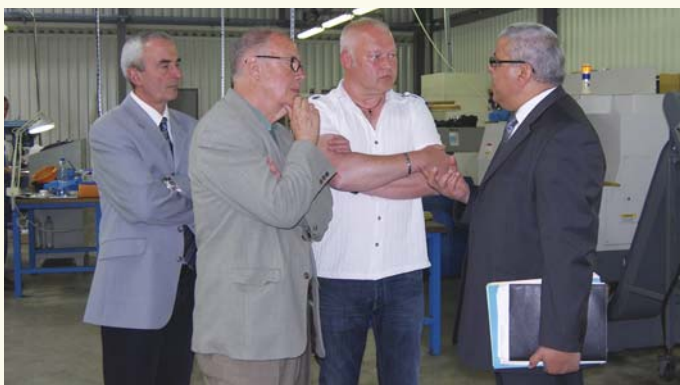
En mai dernier, le Sous-Préfet de Figeac visitait les entreprises du parc Quercypôle. Ici, l'entreprise PMA.