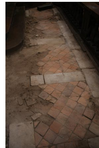
Sol de tomettes et pierres