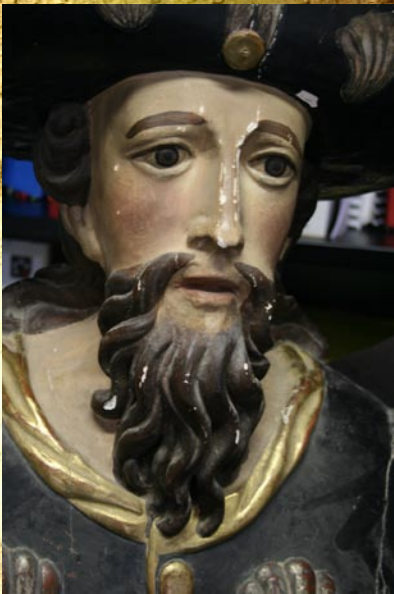
Saint Jacques de Compostelle

La prochaine étape de cette campagne est la restauration du retable dédié à Saint-Jacques et le retour de sa statue invisible à Figeac depuis plusieurs décennies.