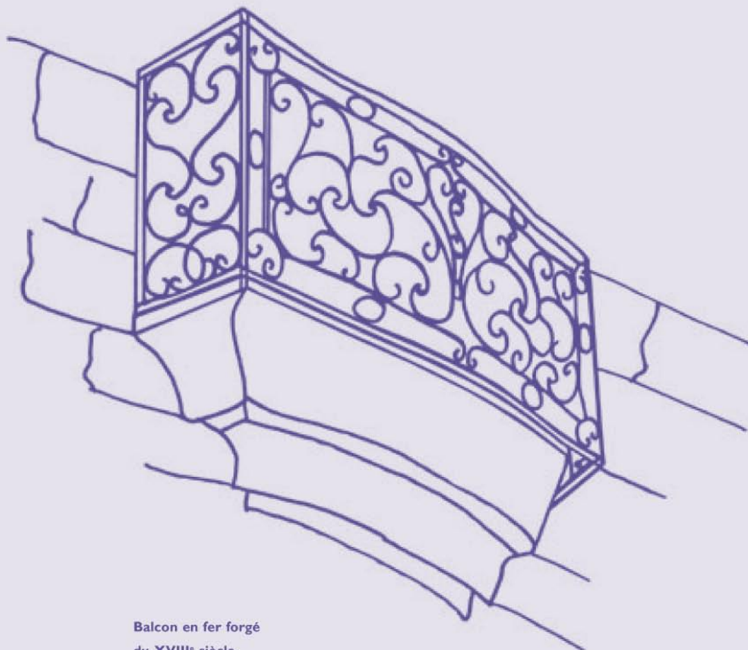
Balcon en fer forgé du XVIII e siècle.