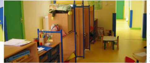
Crèche « Premiers pas en Ségala » (Labathude)