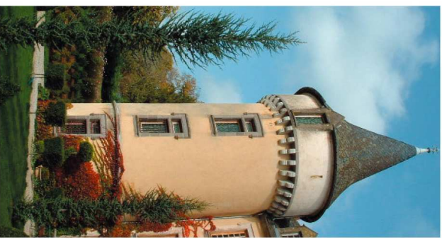
Le Château de Bossières