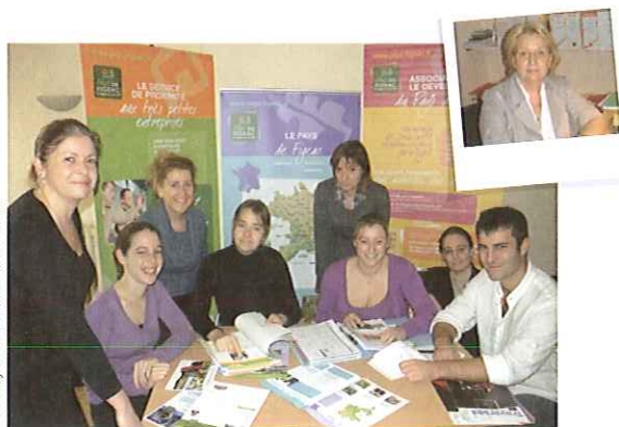
la semaine du lot