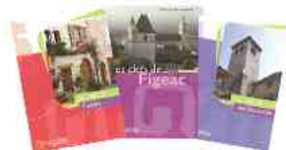
Nouveaux dépliants touristiques

visant à mettre en valeur notre territoire, seront prochainement diffusées gratuitement auprès des communes, Offices de Tourisme, hébergeurs, restaurateurs et lieux de visite du Pays.