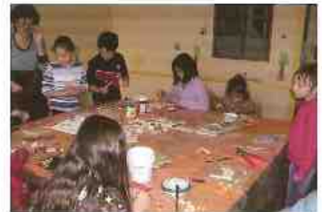
Atelier de mosaïque organisé par l'association « Repaire des 2 vallées »

cieu couvent du village. Grâce au dynamisme de jeunes mères de familles et à la formation d'une animatrice, « Repaire » offre des animations de proximité telles que des ateliers de danse, de poterie, de théâtre ou de gym... tout en s'efforçant d'apporter une réponse adaptée à tous les âges ; autrement dit, des actions qui s'inscrivent en cohérence avec le projet culturel de territoire du Pays de Figeac. Le travail remarquable des membres de cette association leur vaut aujourd'hui une reconnaissance de la part de différents partenaires publics qui affirment leur soutien à ce projet, soutien indispensable au développement d'activités culturelles dans des petites communes comme celle de Lissac-et-Mouret ».